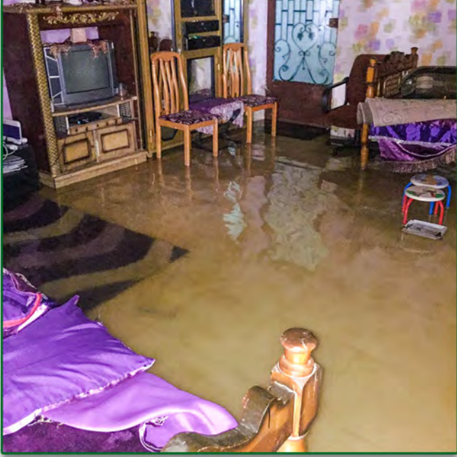
❖ الموقع : قرية الصالحي